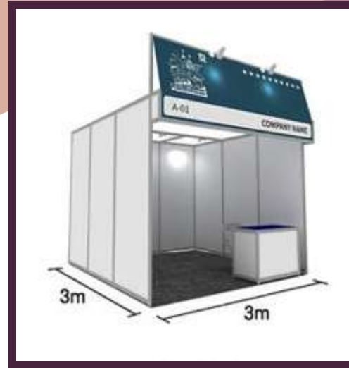
기본 부스 (면적+조립 부스)